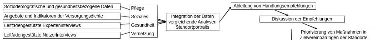
Abbildung 2: Methodische Schritte der Ausgangsanalyse