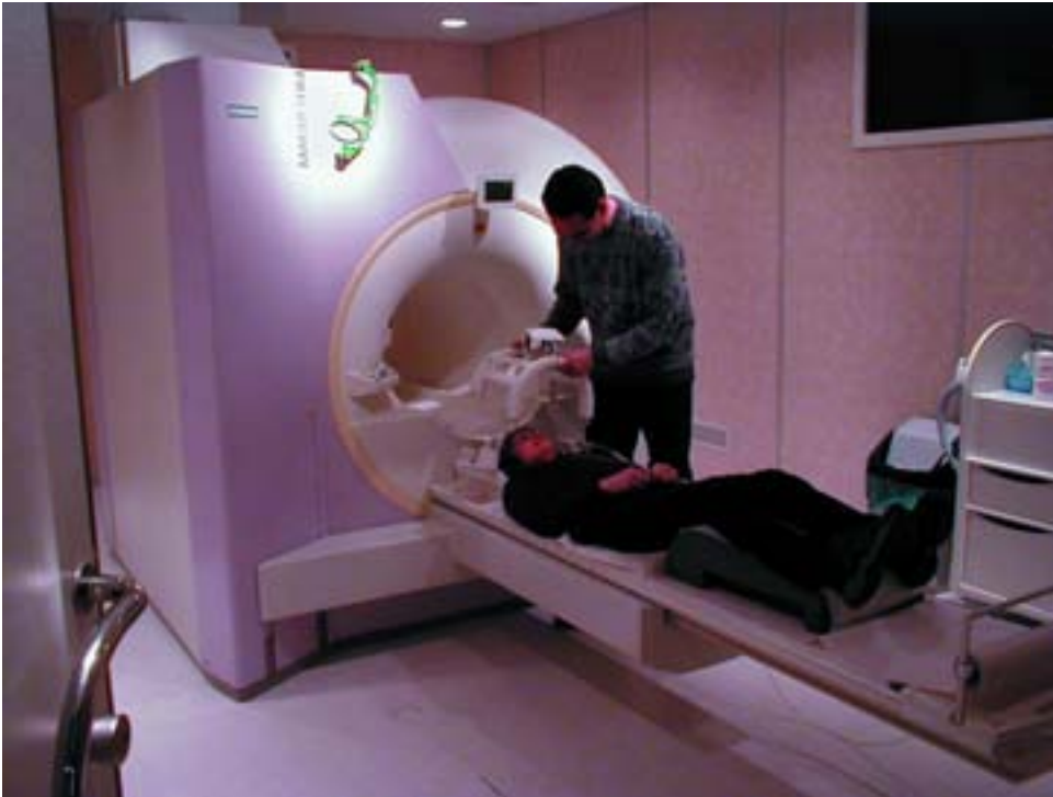
Abbildung 3: Eine weitere wichtige Untersuchungstechnik zur Lokalisierung bestimmter Sprachfunktionen ist die funktionelle Magnetresonanztomographie (fMRT). Das Bild zeigt die Vorbereitung einer Versuchsperson im MRT (Epilepsiezentrum Bethel) zur Untersuchung der Verarbeitung von Eigennamen, konkreten und abstrakten Nomen. Nach dem Anbringen der Gradientenspule wird die Versuchsperson in den Scanner gefahren und hört die sprachlichen Stimuli per Kopfhörer. Bereits wenige Minuten nach Beginn der Untersuchung erscheinen die anatomischen Details des Gehirns auf dem Monitor im benachbarten Kontrollraum. Nach einem weiteren Test ist bereits auch sichtbar, ob die Sprachfunktion der jeweiligen Person überwiegend in der linken (häufig) oder rechten Gehirnhälfte (selten) angesiedelt ist. Die umfangreiche Auswertung über alle Versuchspersonen findet dann erst nach Abschluss der Datenaufnahme statt.

unterschiedliche Wortarten eingeteilt haben. Aber entspricht diese seither nur unwesentlich veränderte Einteilung in Wortarten auch dem Ordnungssystem des Gehirns oder handelt es sich dabei lediglich um eine noch immer alltagstaugliche, jedoch in kognitiver Hinsicht realitätsferne „Erfindung“ der Antike? Um nur ein Beispiel zu nennen: In der Gruppe der Nomen wird in der Linguistik vor allem die Sonderstellung der Eigennamen diskutiert. Diese Diskussion ist bereits viele hundert Jahre alt, und es ist bis jetzt unklar, ob 1. die Eigennamen (Nomina propria) in der Kognition als eigenständige Gruppe existieren und 2. was dann genau zur Gruppe der Eigennamen zu zählen ist (z.B. Vornamen, Ortsnamen, Warennamen usw.).